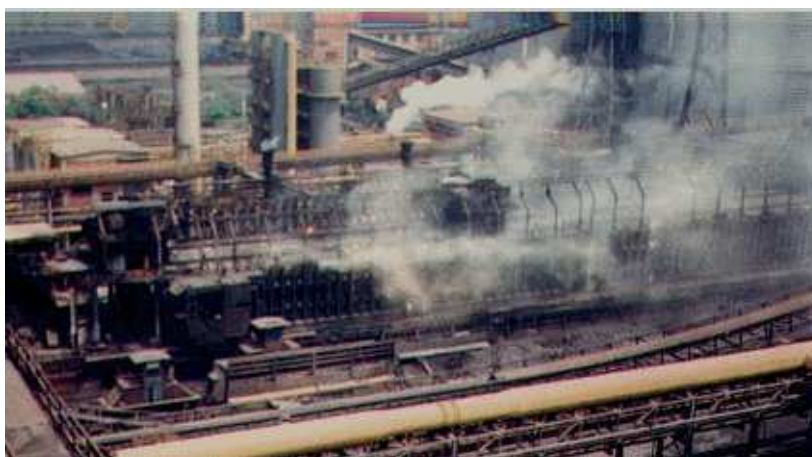
Figura 2 - Vista aérea de uma coqueria